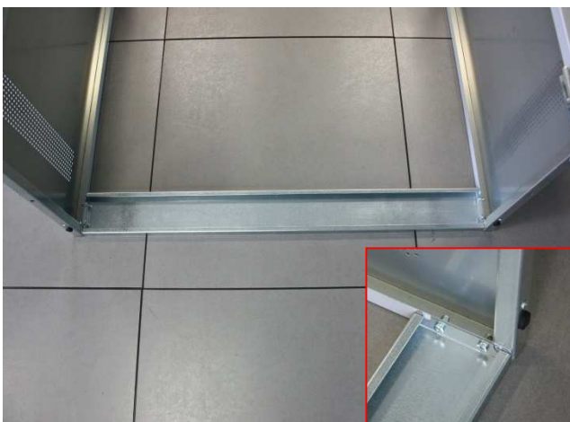
Fig. 3: traversa inferiore / lower horizontal panel