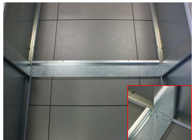
Fig. 4: traversa mediana / middle horizontal panel