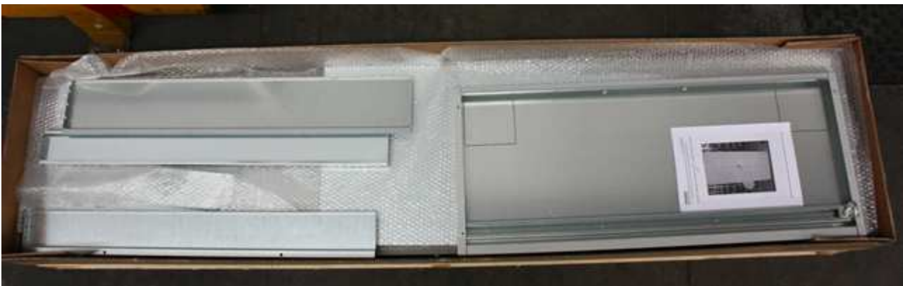
Fig. 1: Confezione/ Box

Attenzione : prima di procedere con il montaggio, individuare una zona dove poter posizionare l'armadio, verificare che il pavimento sia livellato e che sia garantito l'accesso laterale da entrambi i lati. L'armadio andrà inizialmente montato in posizione orizzontale, assicurarsi quindi di avere spazio sufficiente per l'operazione (vedere Fig. 2). Prima di montare ogni componente, rimuovere la pellicola protettiva.