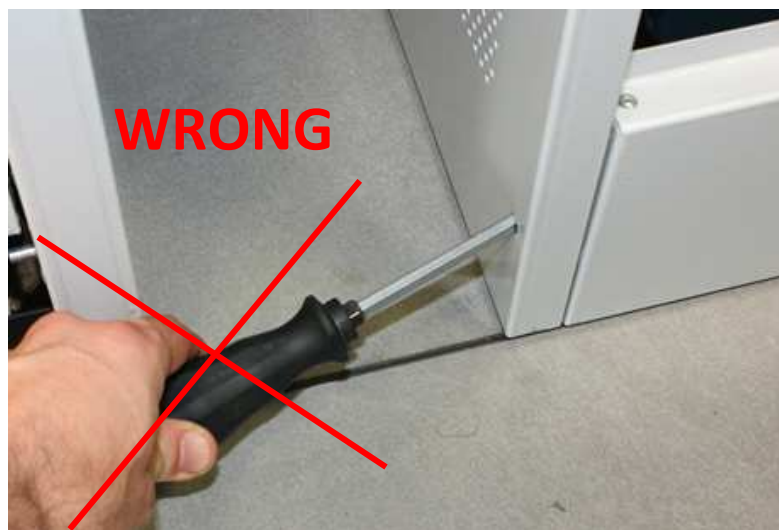
Fig. 18: ATTENTION

Place the cabinet in its final position, where it will stay after elevator commissioning (Pay attention! Leave some space on the right and left hand sides, you need to use a screw driver for the skirting, picture.18).